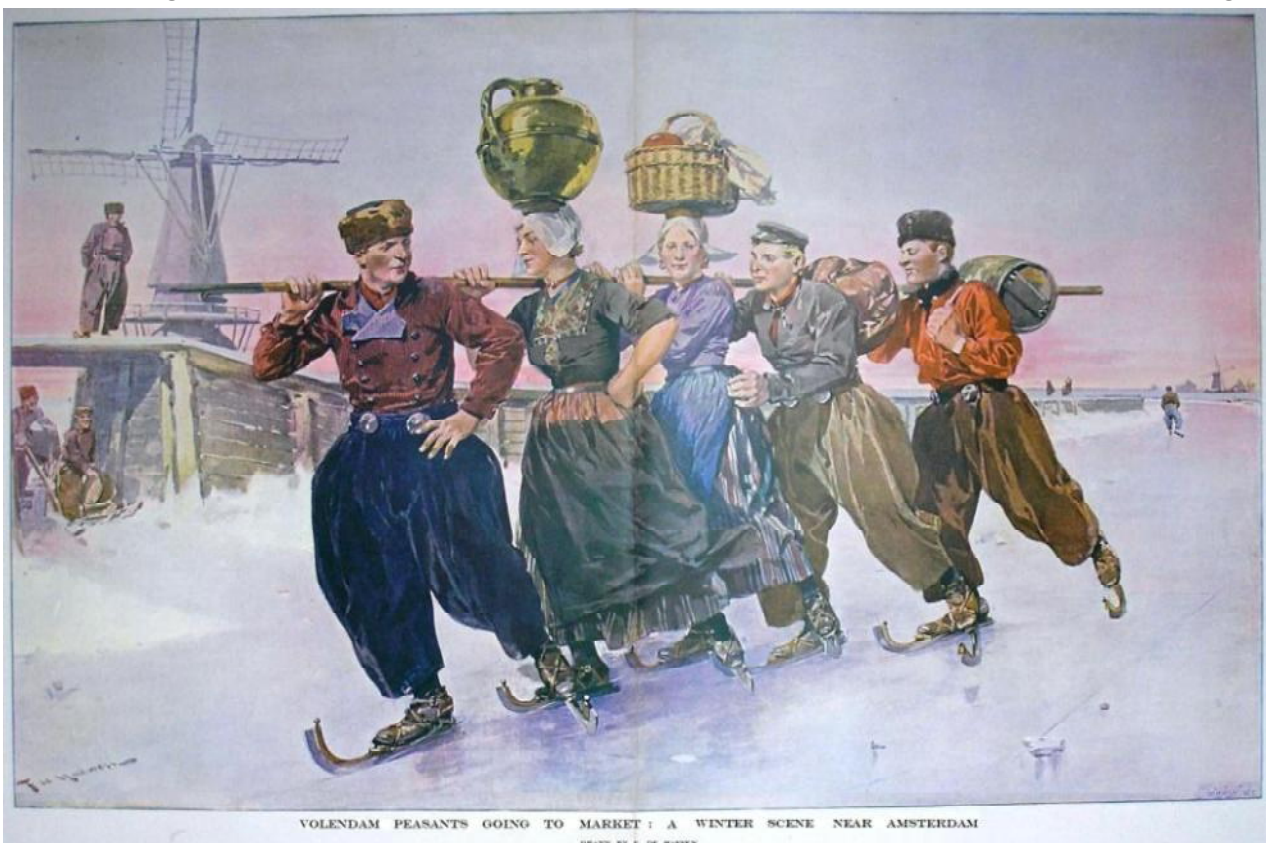
VOLENDAM PEASANTS GOING TO MARKET : A WINTER SCENE NEAR AMSTERDAM DRAWN BY F. DE HAENEN

firma Swain. Blijkens de tekst boven de afbeelding is deze prent uitgegeven als supplement bij The Graphic uit Londen, Engeland. Dit was een geïllustreerd en zeer gerenommeerd nieuwsblad dat wekelijks verscheen van 1869-1932. De poster heeft incl. kader een afmeting van 60x 41 cm en excl. kader 48 x 33 cm. Grappig is